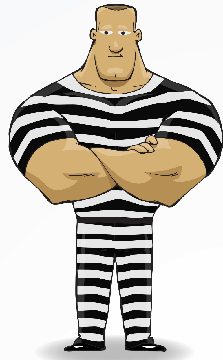
Fremdwahrnehmung der BOS und Veranstalter